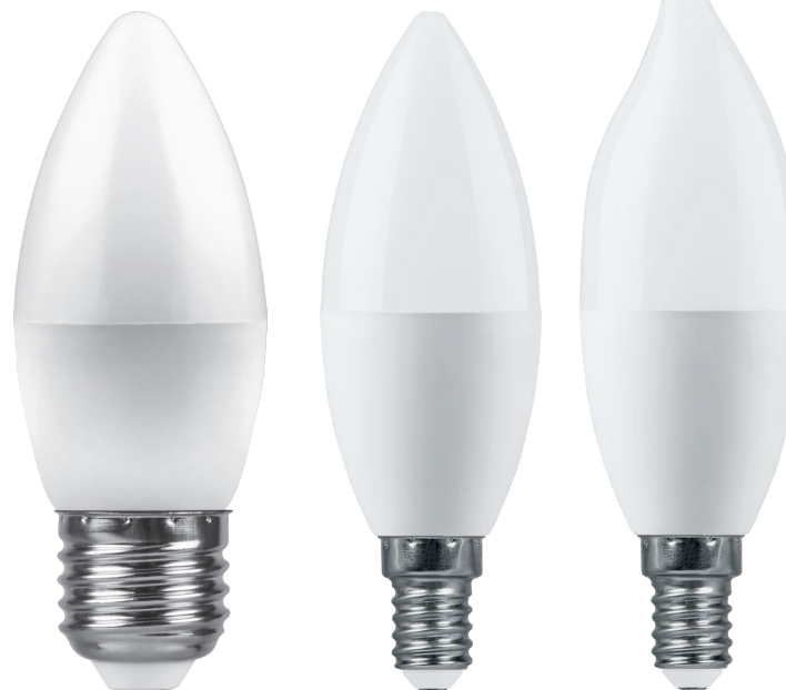
Арт. 38110, 38111, 38112